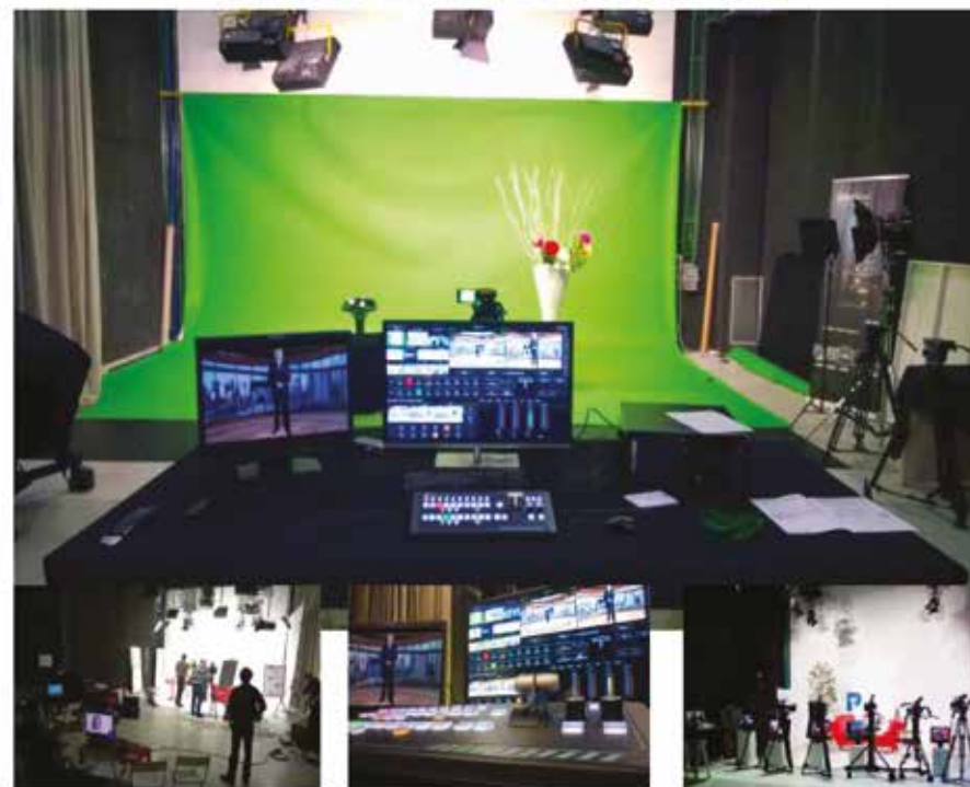
Location per eventi